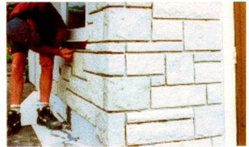
Pemasangan batu sudut dikerjakan lebih dahulu, kemudian bidang datarnya