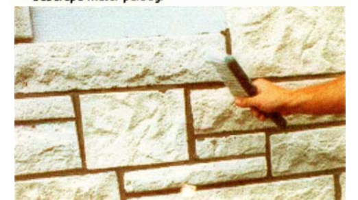
Batu dan pinggiran nat dibersihkan dari sisa-sisa pengecoran hingga bersih dengan menggunakan sikat nylon