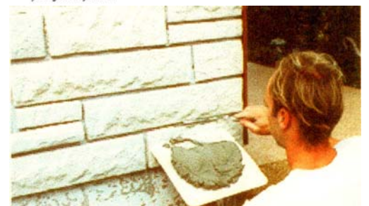
Kemudian pengisian nat dilakukan setelah terpasang beberapa meter persegi