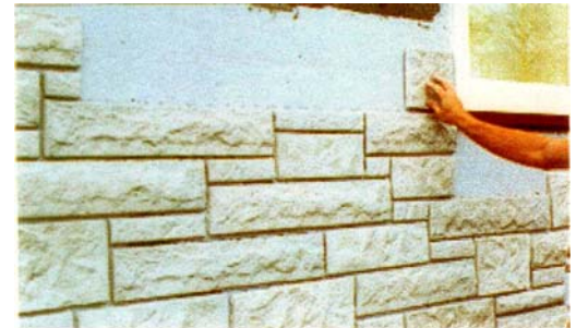
Tarikan garis horizontal untuk membantu rapinya pemasangan